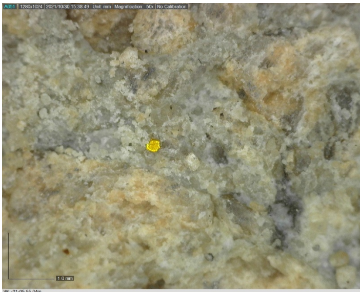
Abbildung 3 - Sichtbares Gold in Bohrung WL-21-05 in 55,04 m Bohrtiefe